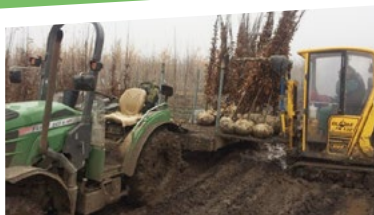
Nakládky a svoz balových stromů