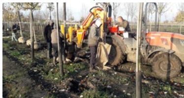
Dobývání stromů se zeminým balem