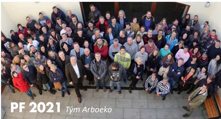
PF 2021 Tým Arboeko

Za celý náš tým bychom rádi poděkovali všem našim zákazníkům za projevovou přízeň v uplynulém roce a do nového roku 2021 Vám popřáli hodně spokojenosti a úspěchů a také prožití klidných a šťastných vánočních svátků.