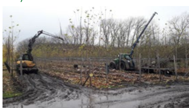
Nakládky stromů na poli