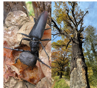
Tesařík obrovský ( Cerambyx cerdo Linnaeus, 1758) a jeho charakteristický stromový biotop