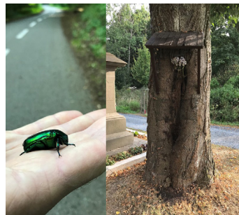
Zlatohlávek skvostný ( Protaetia speciosissima (Scopoli, 1786)) a jeho charakteristický stromový biotop