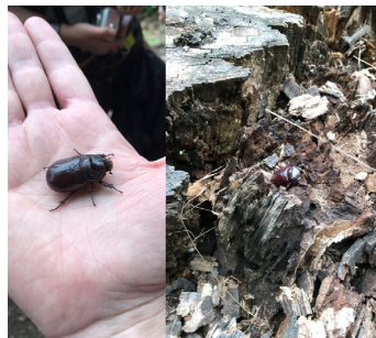
Nosorožík kapucínek ( Oryctes nasicornis (Linnaeus, 1758)) a jeho charakteristický stromový biotop