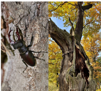
Roháč obecný ( Lucanus cervus (Linnaeus, 1758)) a jeho charakteristický stromový biotop

Ústav ochrany lesů a myslivosti Lesnická a dřevařská fakulta Mendelova univerzita v Brně